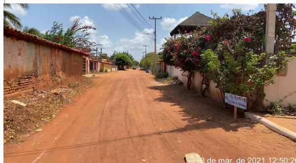
Rua Peixe Serra