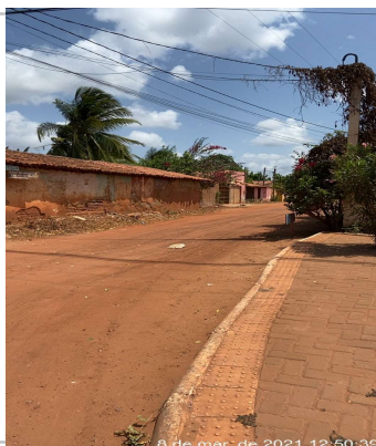
Rua Peixe Serra