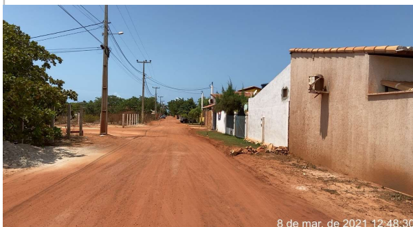
Rua Peixe Serra